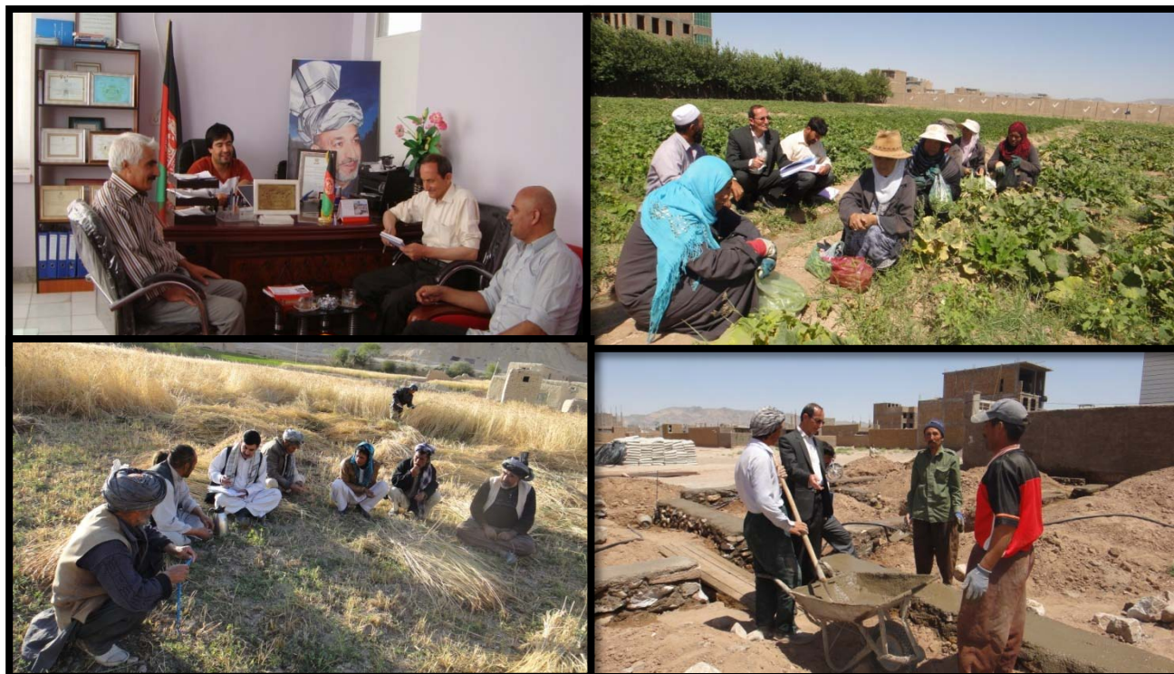
عکس هایی از جریان تطبیق برنامه ارزیابی تاثیرات ماین پاکی در ولایات هرات، سمنگان

تطبیق کننده: ریاست انسجام و هماهنگی تطهیر ماین اداره ملی آماده گی مبارزه با حوادث