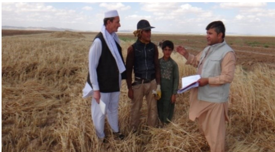
تصویرنمایانگری حاصلات جمع آوری شده توسط مردم محل