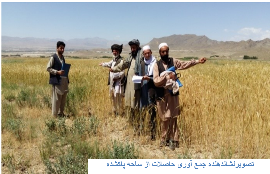
تصویر نشاندهنده جمع آوری حاصلات از ساحه پاکشده