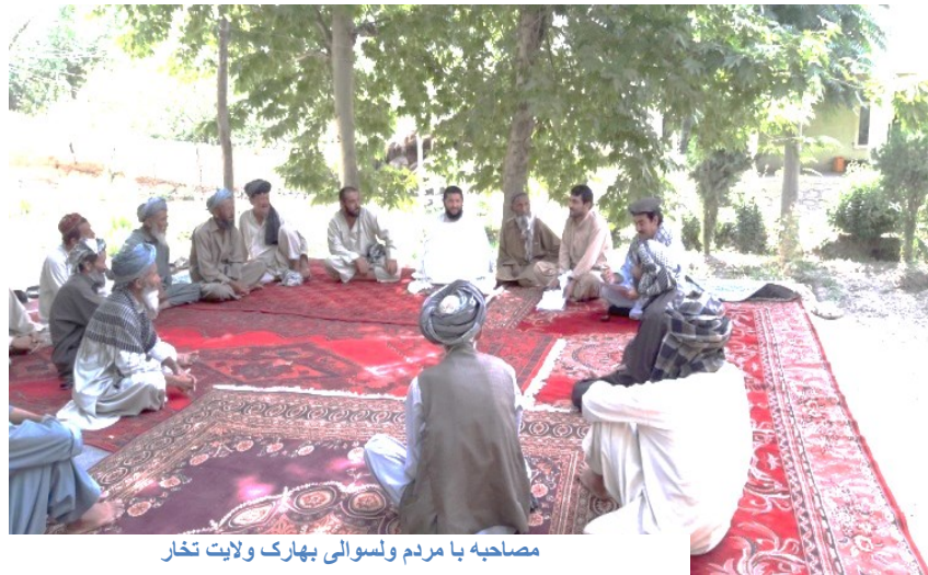
مصاحبه با مردم ولسوالی بهارک ولایت تخار

تخار در امتداد دریا قرار دارد که راه عبور مرور تقریباً ۵۰ قریه میباشد. قبل از پاکسازی این ساحه از وجود ماین ها و مهمات منفجرناشده،